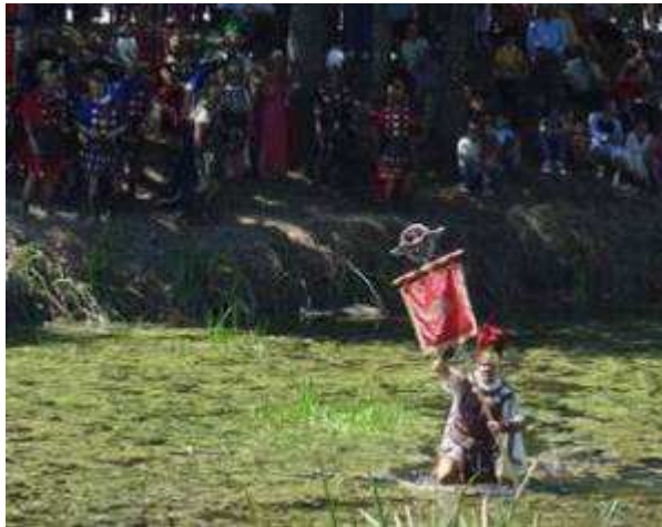
Paso do Lethes na Festa do Esquecemento

Continuando co seu avance cara o norte, Bruto chegara ata o Miño. Non sen antes atravesar o Río do Esquecemento, onde ten lugar o coñecido episodio do Lethes, no que nunha mostra de coraxe, arrebatándollelo estandarte o signifer[76], o procónsul Décimo pasou o río, e chamou os seus soldados dende a outra veira, amosándolles que non perdera a memoria, rachando así coa antiga superstición. Feito do que atopamos referencias en: