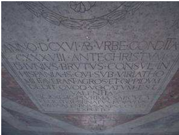
Lápida conmemorativa da Fundación de Valencia

E xa pouco antes da súa morte, no 121 a. Xto., sabemos que Décimus Brutus Callaicus, deu o seu apoio, xunto con outros opositores, a Lucius Opimius[97] que encabezaba a represión contra os Gracos, sendo naquela ocasión, cando Caio Sempronio Graco e os seus seguidores uns 3000, despois de ser declarados inimigos públicos de Roma, foron asasinados cruelmente, curiosamente, tamén un 9 de Xunio.